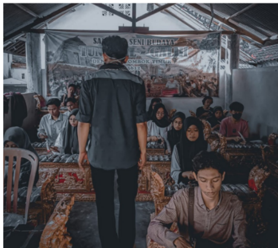
Gambar 2. Latihan Gamelan Tokol di Sanggar Tunggal Galih.

Langkah selanjutnya adalah melaksanakan tutorial cara membaca notasi pada partitur dan mengaplikasikan pada alat musik Gamelan dengan teknik pukulan dan permainan yang bervariasi, yakni Teknik pukulan tunggal, ganda, variasi genap-ganjil atau Polos-Sangsih , variasi bentuk Bekelitan dan Betimbalan . Setelah mengetahui dan bisa mempraktikkan Teknik pukulan dan permainan, dilanjutkan dengan bentuk variasi pola dan progres model, yakni dengan progres model Jawa, Sunda dan Bali yang diterapkan pada alat musik tradisi Sasak.