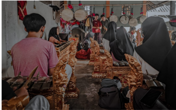
Gambar 3. Pendampingan oleh mahasiswa saat kegiatan

semangat bagi peserta dan mahasiswa sehingga akan lebih tertarik untuk membuat kreasi-kreasi yang baru dan lebih bagus lagi. Berikut adalah gambar saat proses pendampingan dan pelatihan Gamelan Tokol .