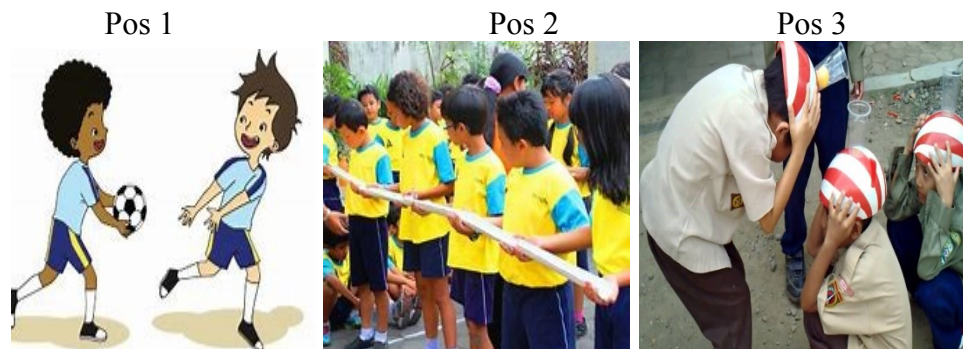
Gambar 3.1 Rancangan Permainan Estafet Bola

Berikut adalah rancangan pengembangan permainan estafet bola pada penelitian ini: